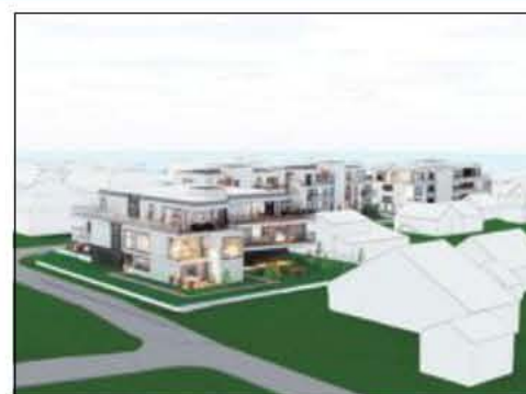
LAVBLOKKER: Illustrasjonen viser leilighetskomplekset nedenfor Teiegården sett fra sørøst.