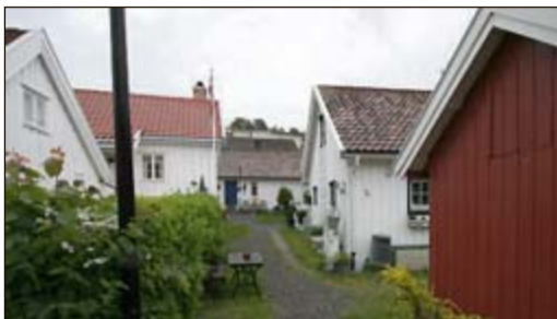
Vern av trebebyggelsen er tema i Drøbak kino i morgen.