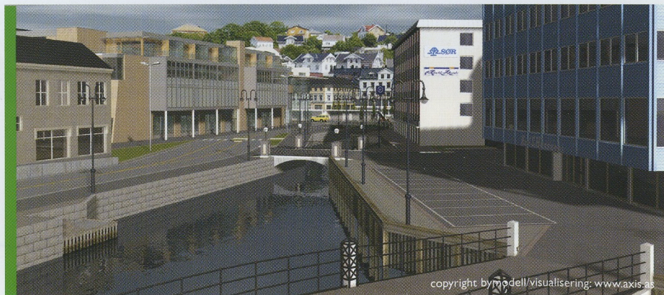
Byen sett fra Kittelsbukt.