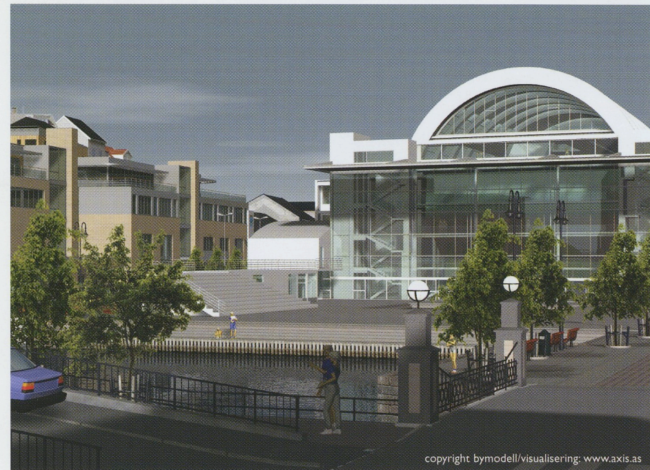
"Kulturhuset" sett fra kirkebasaren.