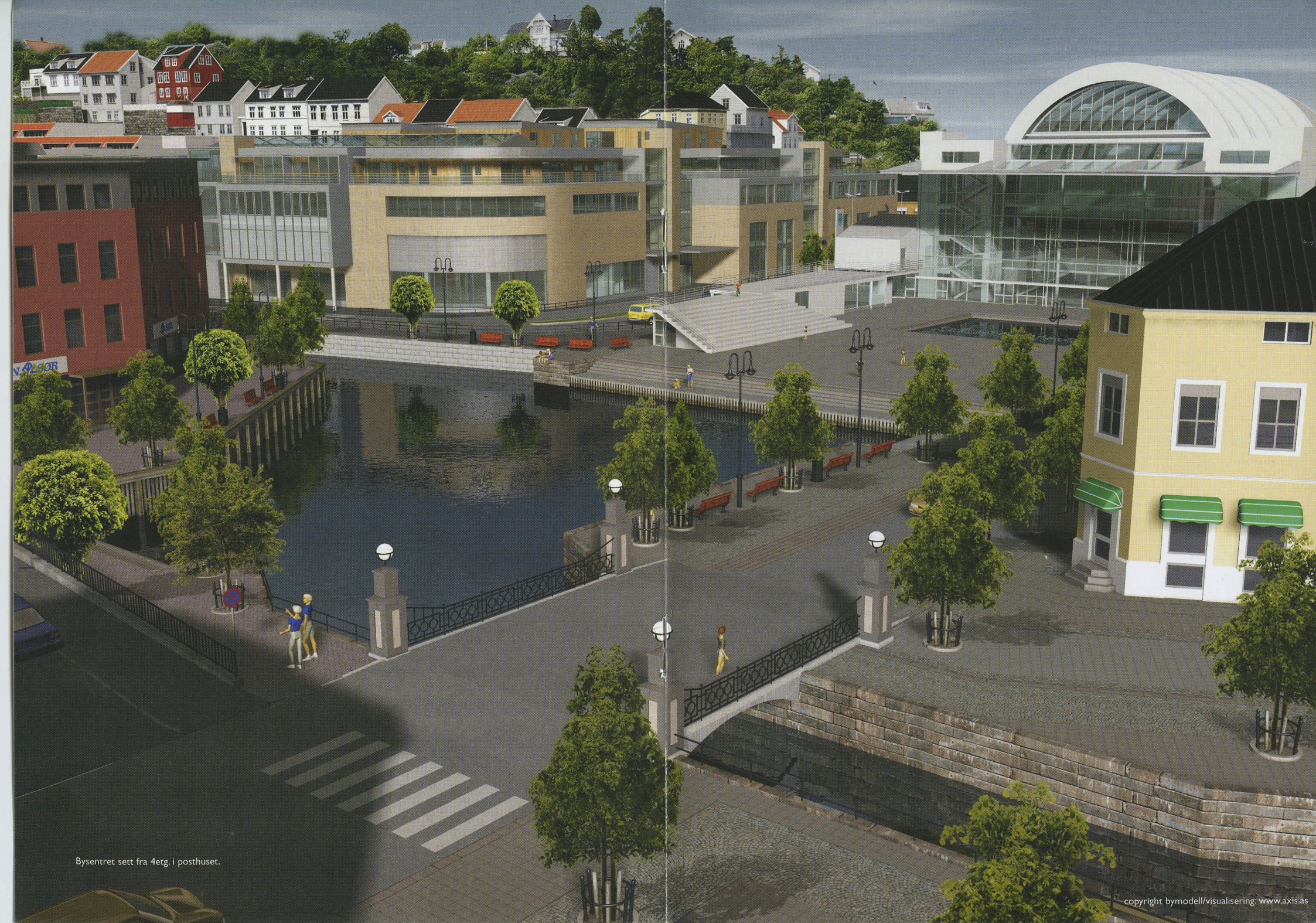
Bysentret sett fra 4etg. i posthuset.