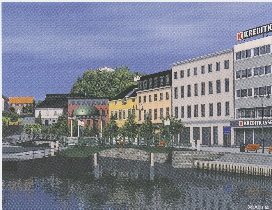
3d: Axis as

Disse firmaer støtter kanalsaken, og har vært med på å finansiere denne utgivelsen: