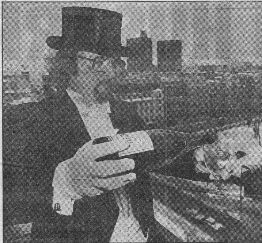
Skål for Oslo, la oss få gratis sjampis, ørretdam i Ditten-datten hullet og data-spill til sosialsentrene.

Eller de kan brukes som fyllmasse i Ditten-