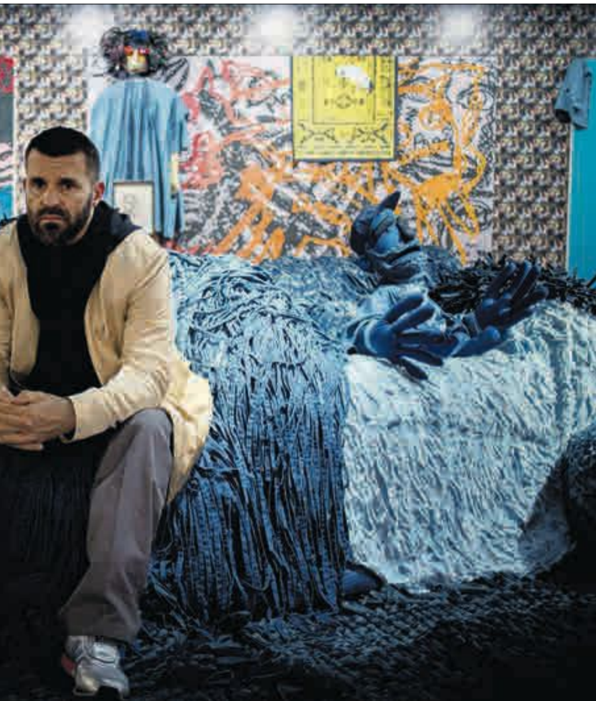
Edvard Munch på Munch-museet i Oslo, får hard motstand mot sitt nye byggeprosjekt.