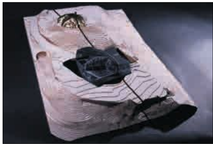
PÅ USIKKER GRUNN: Melgaard ønsker å bygge boligen på fredet grunn på Kikutkollen i Oslo, like ved Edvard Munchs vinteratelier på Ekely.

atelier på Ekely er også negative til utbygging av Kikutkollen.