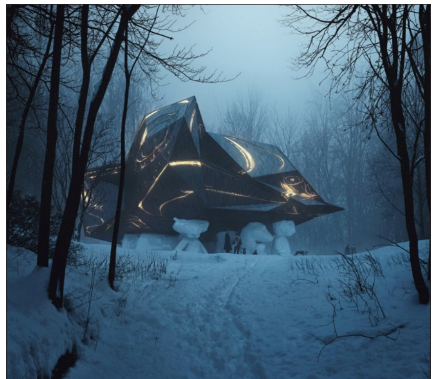
Innleggsforfatteren er ikke imponert over Bjarne Melgaards dødshus på Ekely i Oslo.

Sendes til: debatt@dagsavisen.no Legg ved portrettfoto.