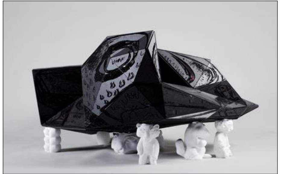
Snøhettas opprinnelige forslag til «A House to Die in» er laget med Bjarne Melgaards skisser som grunnlag.