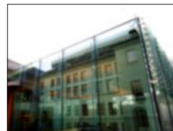
Norsk Arkitekturmuseum feirer 40 år.

«Arkitektur på museum. Et 40-årsjubileum» åpner 5. februar på museet som i dag ligger på Bankplassen i Oslo – i en bygning først tegnet av arkitekt Christian Heinrich Grosch i 1830 som Norges Banks første bygg. Sverre Fehn sto for ombygging og utvidelse før Nasjonalmuseet – Arkitektur åpnet i 2008. Ifølge museet vil jubileumsutstillingen både fortelle historien og reflektere over framtida. Samlingen til Norsk Arkitek-