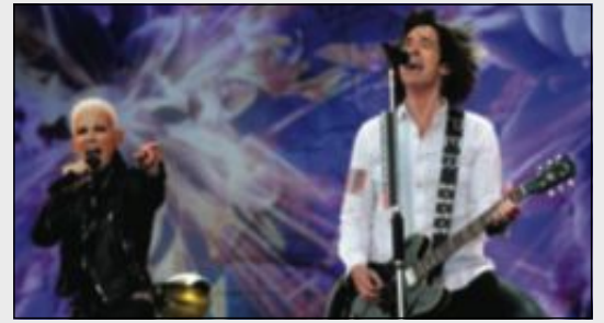
Marie Fredriksson og Per Gessle i Roxette.

Must Have Been Love». De har solgt rundt 75 millioner plater. Duoen tok pause i 2002, men har siden 2009 vært tilbake både med plater og konserter. Drammen Elvefestival flytter i år tilbake til Gamle kirkeplass, med plass til 8.000 mennesker den dagen Roxette kommer til byen.