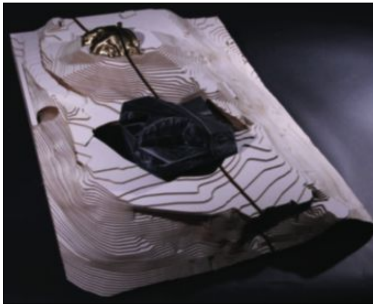
Mesteparten av dødshuset vil være under bakken.

– Jeg ser på dette prosjektet som ekstremt gjennomarbeidet og fantasifullt. Mange kunstnere har jobbet med design og arkitektur, men det er sjelden at de får realisert noe som dette, som kan reise prinsipielle spørsmål rundt hva det vil si å bo og hva gjør et bygg til å leve