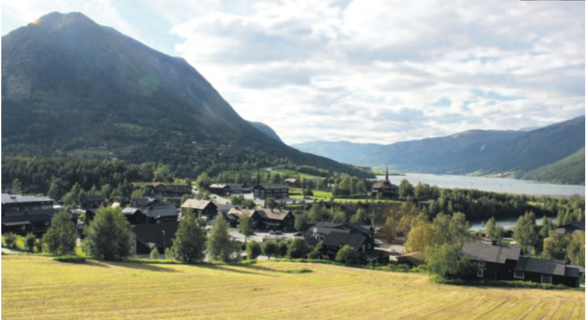
Brun og blid ligg Lom ved rota av det majestetiske Lomseggi. Kommunen er innfallsport til tre nasjonalparker: Breheimen, Jotunheimen og Reinheimen. Statusen som nasjonalparklandsby set krav til miljø og byggeskikk i sentrum.