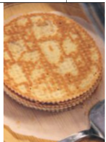
Hotella tilbyr turistiske menyar, men på Coop-kantina kan du unne deg ein lokal spesialitet for ein billeg penge: rjomebrød.