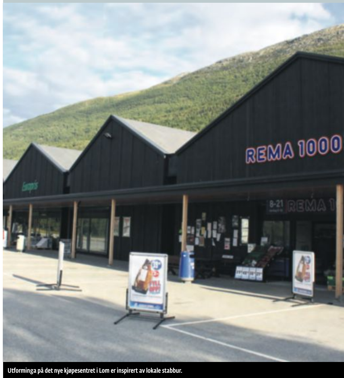
Utforminga på det nye kjøpesentret i Lom er inspirert av lokale stabbur.

– Ja, om reglane kravde det. Det viktigaste er å ha god dia-log med kommunen. Det er absolutt artig med eit kjøpe-senter som ikkje fylgjer den vanlege utforminga, men som er utradisjonelt og originalt, endå det skaper utfordringar for drifta.