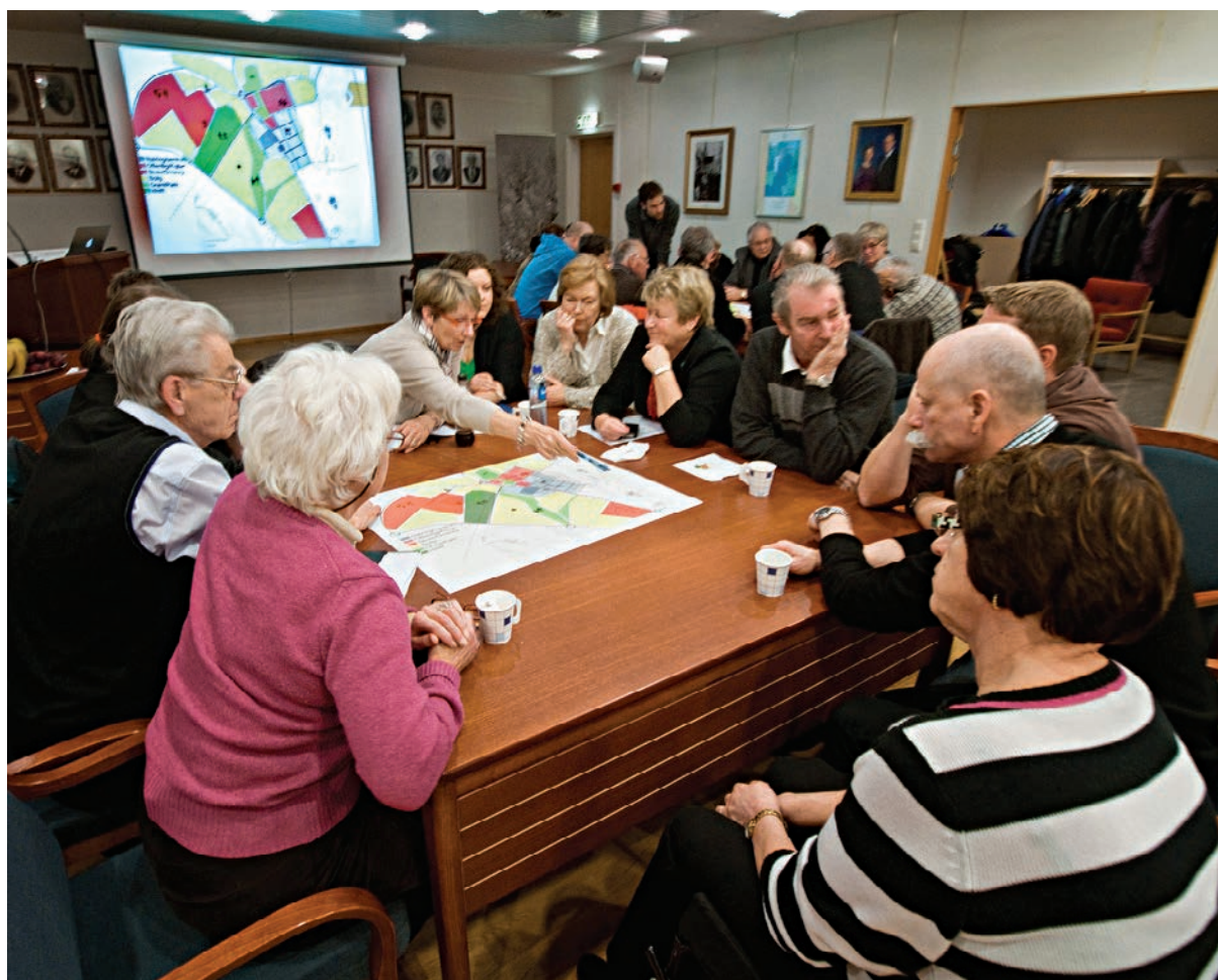
Plansmier kan være en god måte å organisere lokalplanlegging og medvirkning på, men da må resultatene tas på alvor av kommunen. Deltakerne i denne plansmia jobber med utformingen av Ask sentrum i Gjerdrum kommune i Akershus.