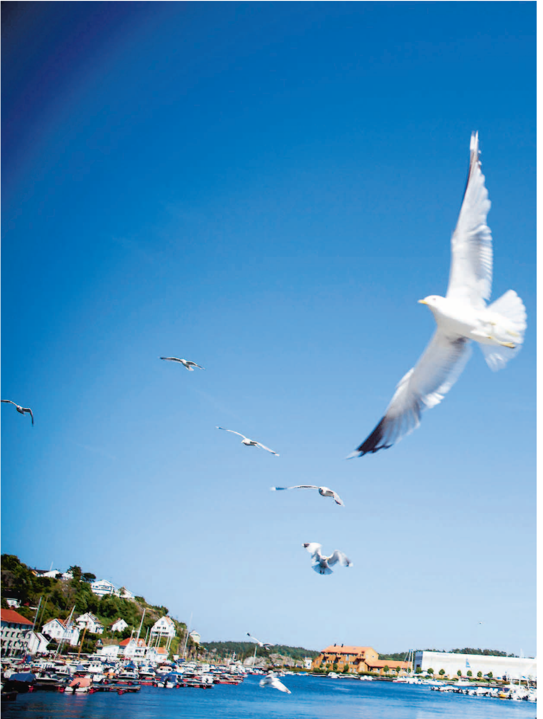
STRIDER OM RISØR. Risør kalles den hvite by ved Skagerrak og er en av Norges mest verneverdige byer. Det som skulle bli en ny, levende bydel ved innseilingen, har resultert i et leilighetskompleks.