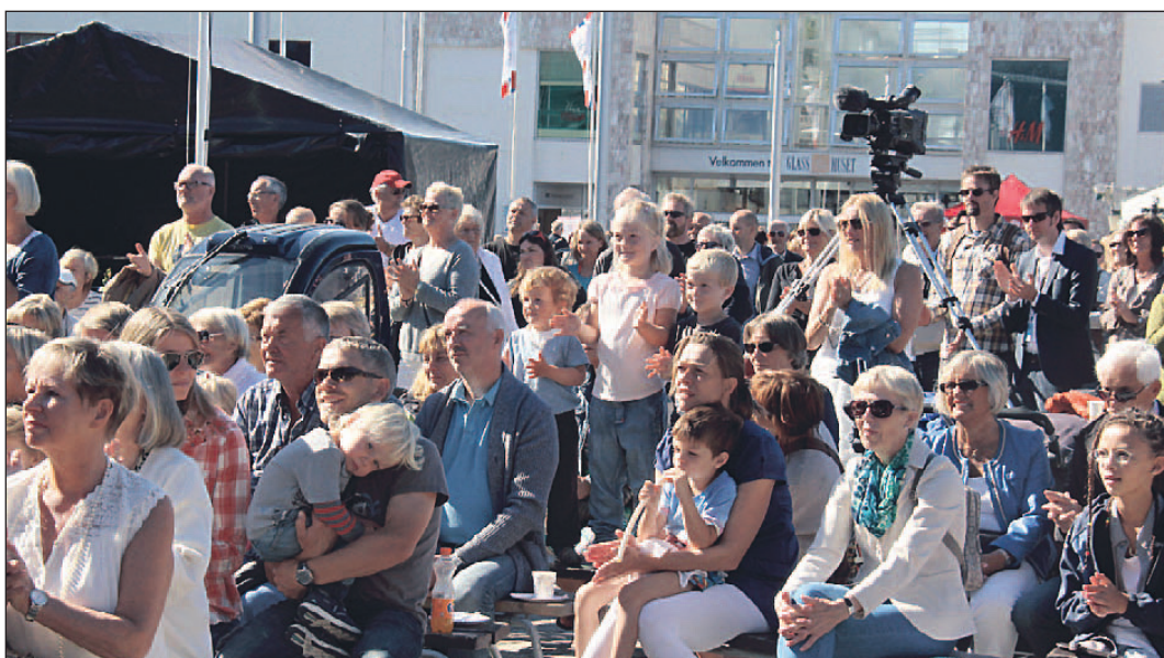
Bodøfolk må på et tidlig tidspunkt i prosessen være med å skape steder som kan utvikle en fortsatt tilhørighet og en kultivert atmosfære. Bildet er fra åpningen av Musikkfestuka i fjor.

Dette gjør at eventuelle motkrefter må operasjonalisere sine synspunkter; deres uenighet må via protester, motforslag og innsigelser eie en viss styrke. Men skal demokratiet ha mulighet til eventuelt å korrigere eller avvise et prosjekt, må motkreftene institusjonaliseres; de må hjemles i lovverket på en slik