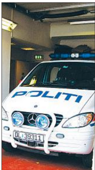
I Risør ble det tirsdag meldt om et innbrudd på Solsiden.