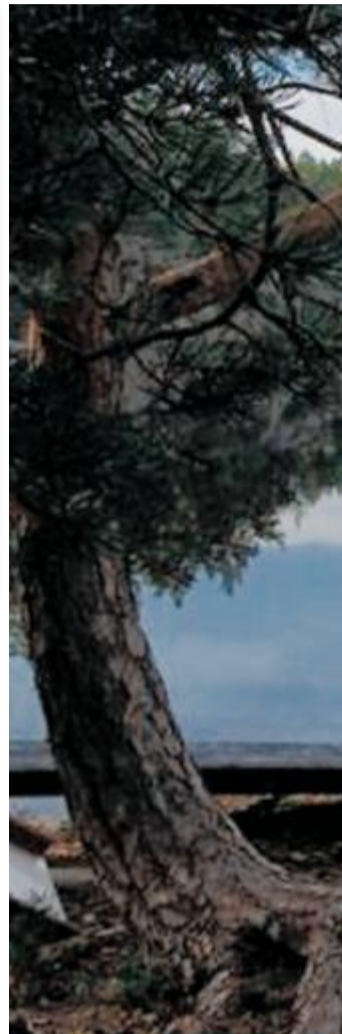
Kongepuddelen Thira (10) er fra Kragerø.

► en evigbrennende ild, ble tent med en reklamejobb i 1985.