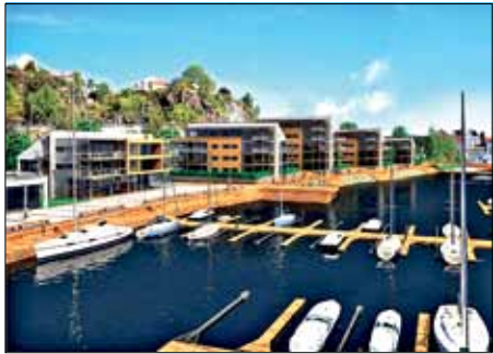
ILL: LINK ARKITEKTUR