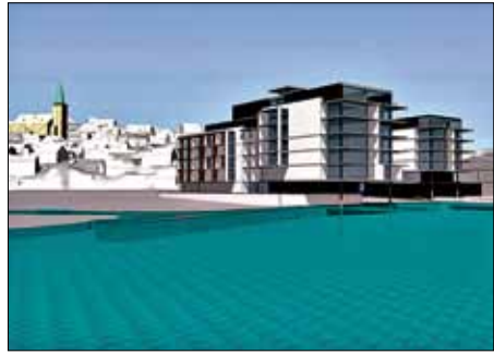
ILL: ASPLAN VIAK