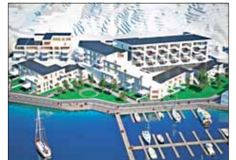
ILL: OXIVISUALS/BLOKK ARKITEKTER AS