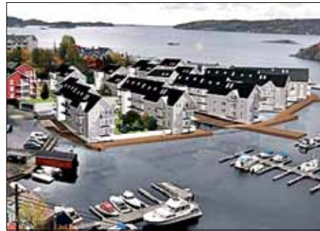
ILL: ARKITEKTHUSET KRAGERØ