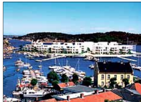
ILL: PETTER BOGEN ARKITEKTKONTOR