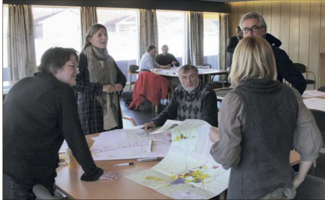
IVRIGE: I går ettermiddag foregikk det hektiske planleggingsdetaljer før prosjektet skal legges fram for publikum i kveld.

Det var plassert rundt 100 post-it lapper på tavlene, hvor et kort sammendrag finnes tilgjengelig til kveldens møte. Av andre interessante innslag var at siloen bør dekoreres, og at det viktigste inovatørene er rakttingene selv.