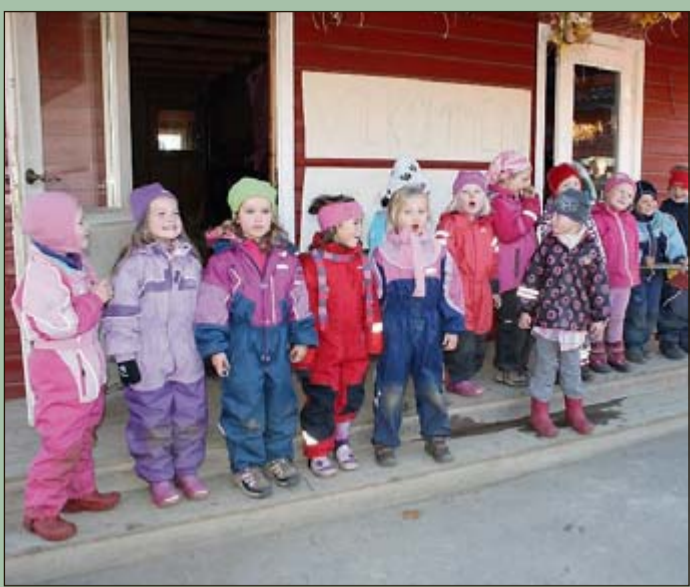
I MARKEDET: Barna fyller opp plassene i de kommunale barnehagene.