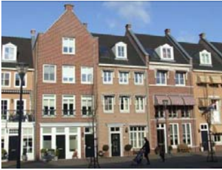
Brandevoort i Holland, New Urbanism