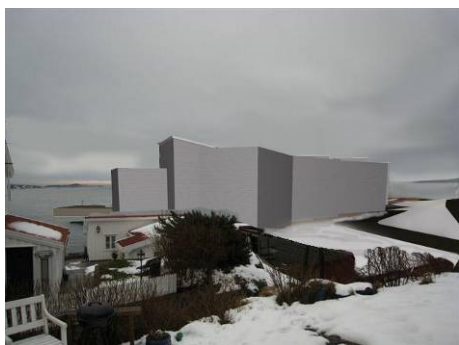
2007 Mot foreslått utbygging i Flisvika, Risør Allgrønns illustrasjon av konsekvenser