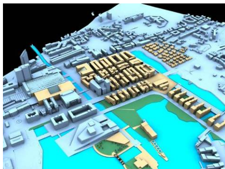
Alternativ plan, Bjørvika i Oslo Resultat fra plansmien i februar 2008