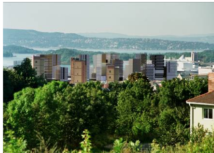
Bjørsvika m. "Barcode", Oslo