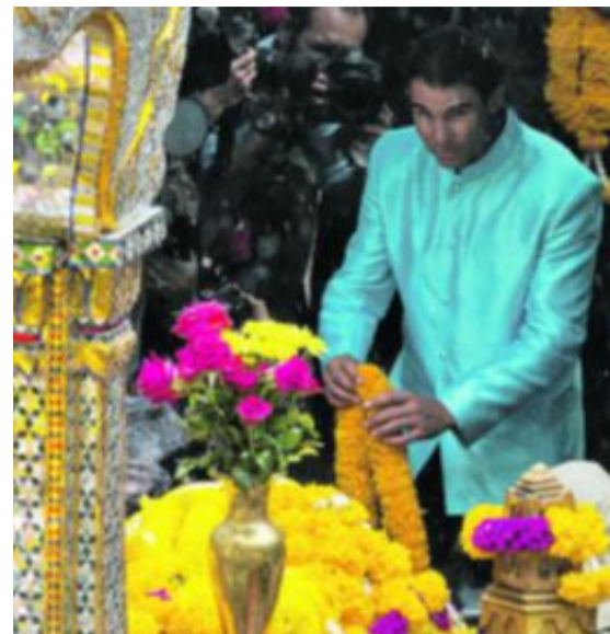
MINNES: Tennisstjernen Rafael Nadal besøker Erawan tidligere denne måneden.

Med mindre Geir Lippestad ønsker å skrive et nytt revynummer.