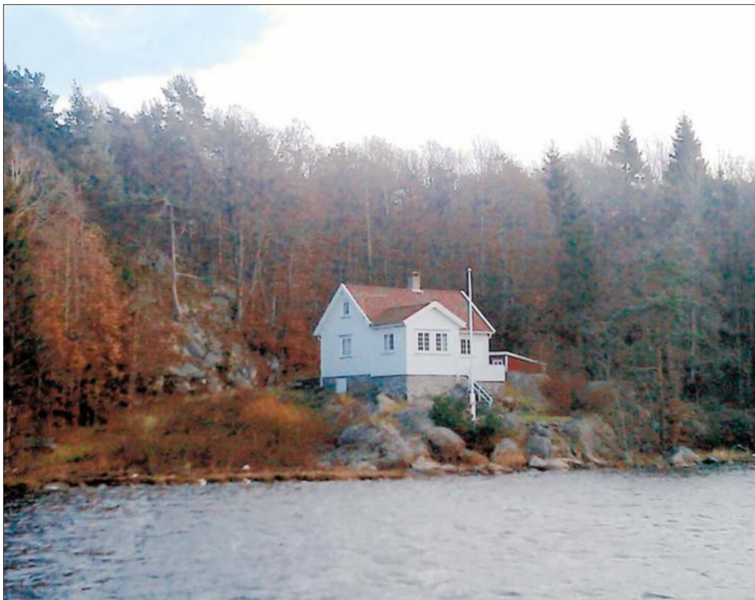
INNØSES? Denne hytta kan sammen med fem andre fritidseiendommer måtte bli innløst for å sikre allmennheten tilgang til sjøen.

Seks fritidseiendommer må innløses dersom utbyggingen på Flørenes vedtas i sin helhet. Dette vil koste Lillesand kommune dyrt. Eksempelvis ble eiendommen Bjørkodden solgt for 8,3 millioner kroner i september i fjor, mens en av de andre eiendommene nå er til salgs for 6,9 millioner.