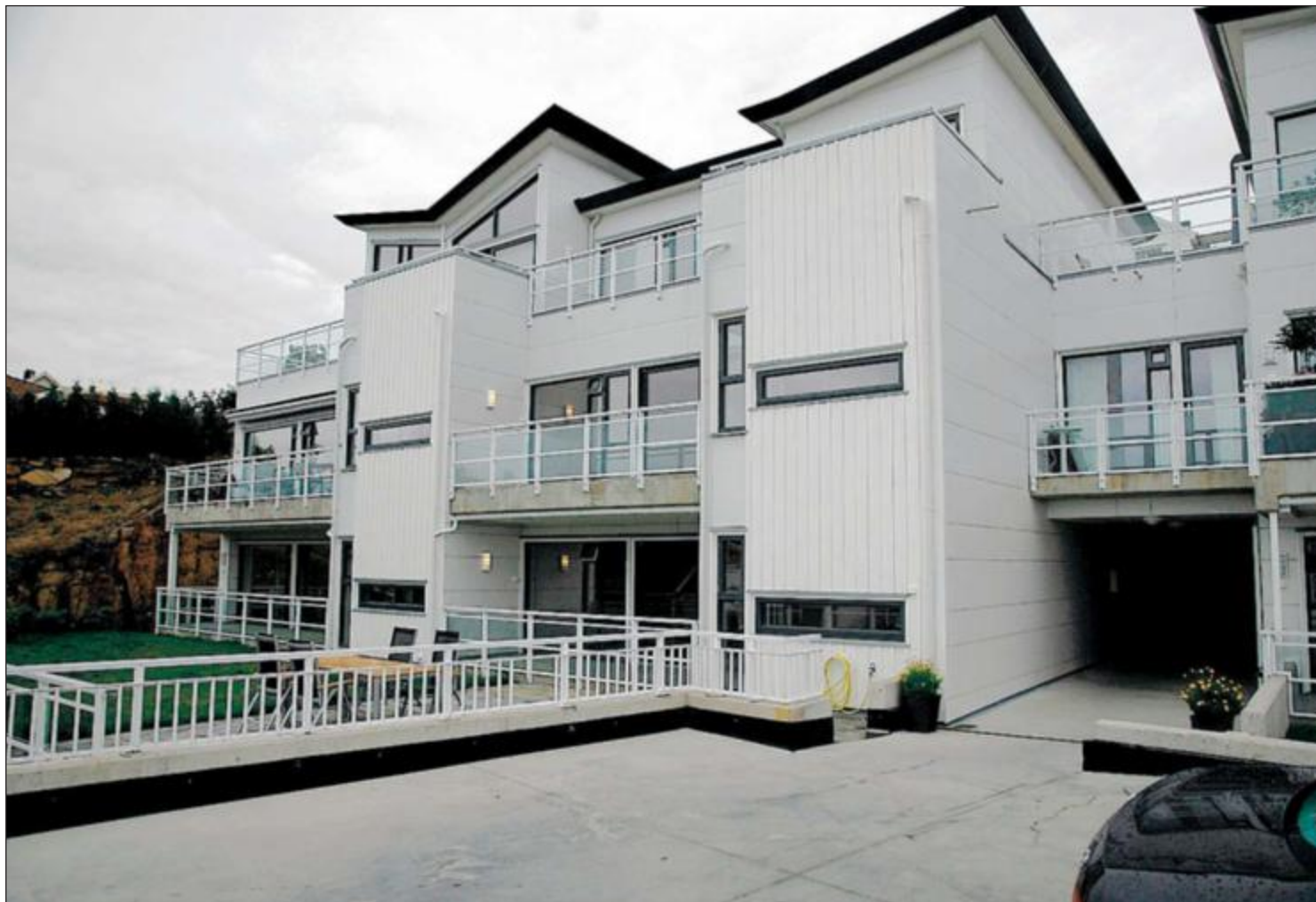
ENDELIG: Fylkesmannen har stadfestet kommunens vedtak om adresser for Skolegata 19. Leilighetene med inngang fra trappehuset får alle adressen Skolegata 19C.

Heller ikke når det gjelder postlevering ser kommunen at