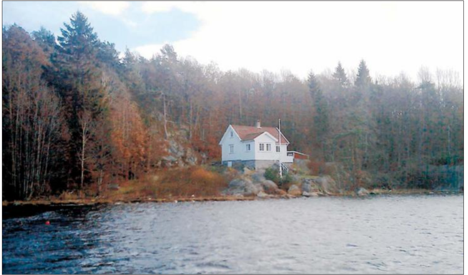
FLØRENES: Hytte som eventuelt må innløses gnr. 42/bnr. 215.

– Konsekvensutredningen peker på utfordringer med hensyn til vannutskiftning og vannkvaliteten i Virekilen, hvilket betyr at det må påregnes negativ påvirkning også utover småbåthavnens avgrensning ved eventuelle utslipp/forurensning, og som følge av økt sedimentering, heter det i uttalelsen, hvor det påpekes at eventuell servicebrygge og arealer for båtopleg på land ikke