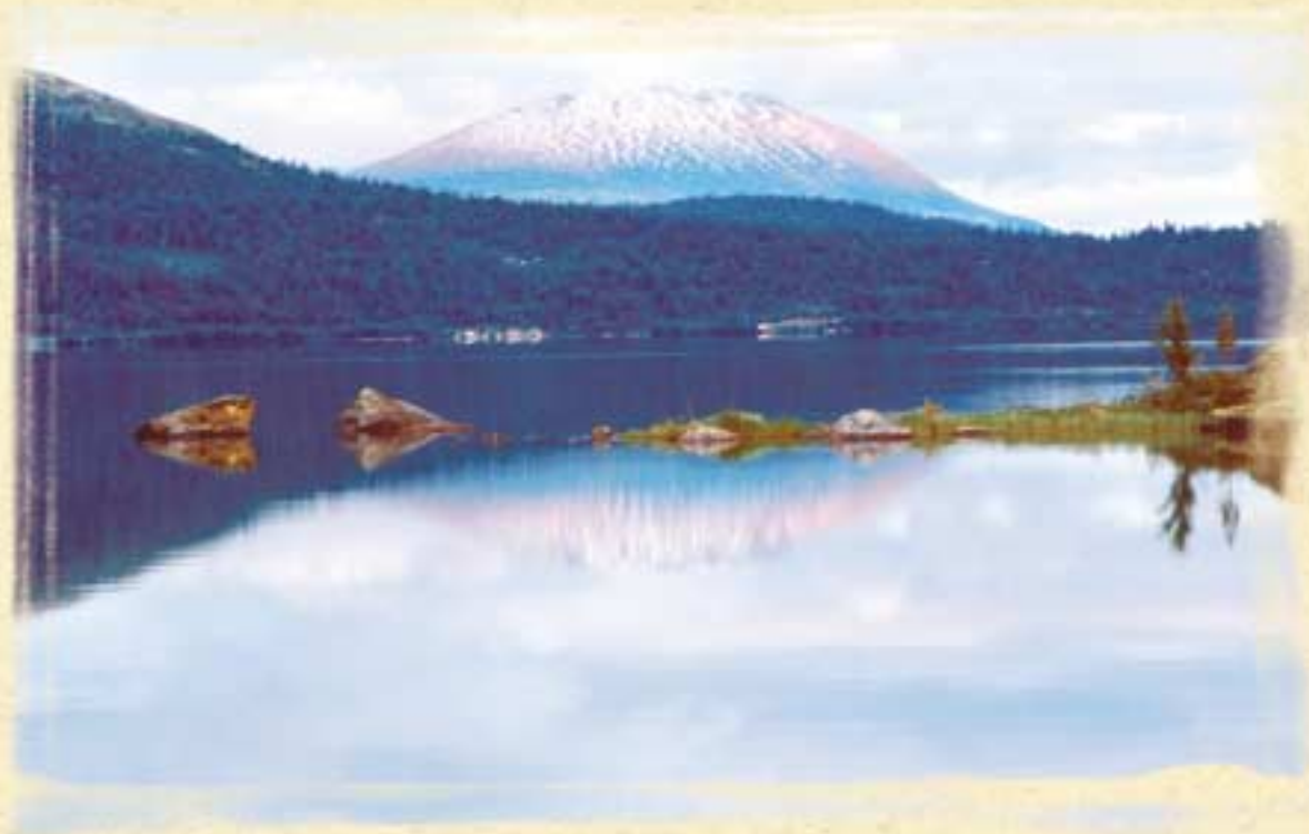
Naturopplevelsene er mange rundt Lemonsjøen.

Statskog Lillehammer, 61 24 85 00, postadresse over, eller e-post: sor-norge@statskog.no