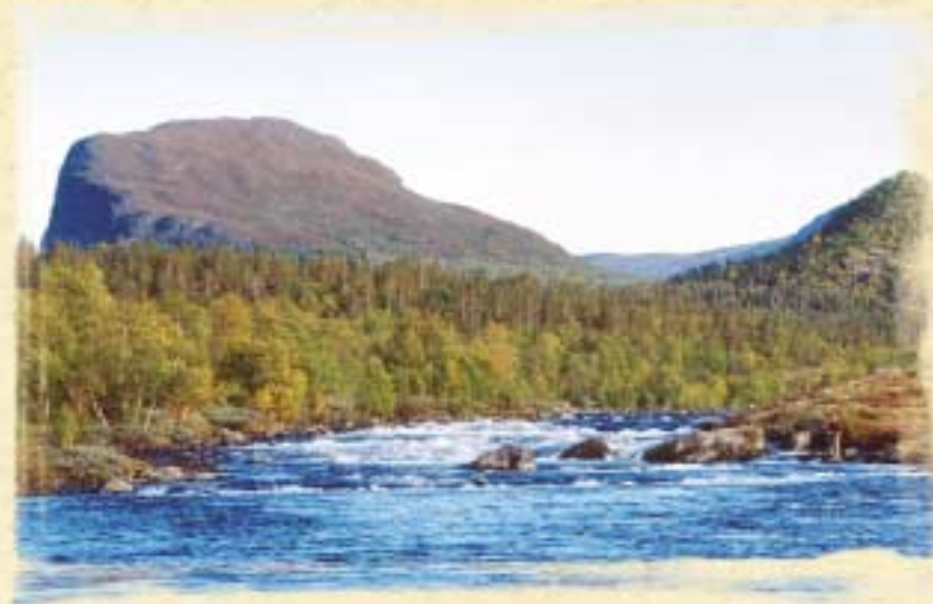
Sjøa med Griningsdalskampen i bakgrunnen.