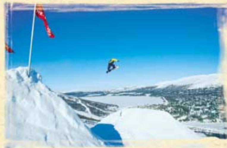
Skientusiast i fri dressur. Lemonsjøen hyttfeltet nede til høyre.

På eget ansvar kan du finne områder, både over og under tregrensa, som er godt egnet for frikjøring.