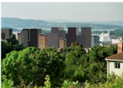
Bjørvika m. "Barcode", Oslo

Det hender ofte i et lokalsamfunn at det lanseres prosjekter i regi av en allianse mellom utbyggere og folkevalgte, hvor det lenge før noen berørte aner noe om det, er lagt tunge føringer. På ett eller annet senere tidspunkt vil den lokale befolkning, hvis de er uenige, bli tvunget til å komme springende etter og improvisere motstand så godt de kan. Som regel er det allerede for sent. Her er noen eksempler: