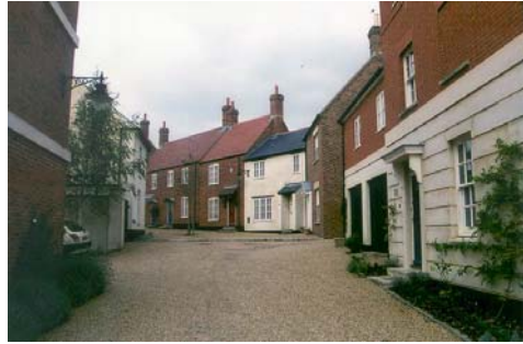
Poundbury i Dorset, Prince Charles' landsby