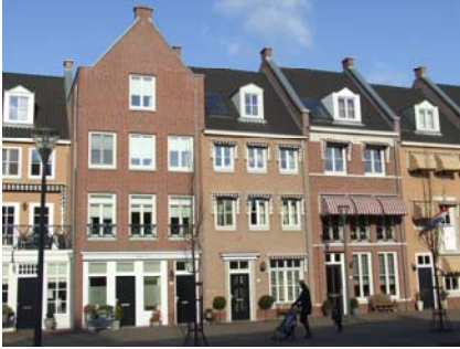
Brandevoort i Holland, New Urbanism