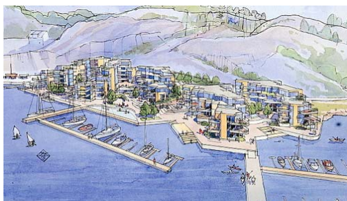
Drabantbyblokker i trehusbyen Risør

Private som ønsker å bygge og etablere virksomheter har selvsagt anledning til å utvikle sine planer uten offentlig innsyn. Men utbyggere er allerede i dag pliktige til å annonsere oppstart av reguleringsarbeid. Dette bør utvides til krav om å invitere lokalsamfunnet til innsyn og påvirkning. Kommuner bør også i større grad trekke lokalbefolkningen aktivt med i arealplanlegging på et tidlig tidspunkt.