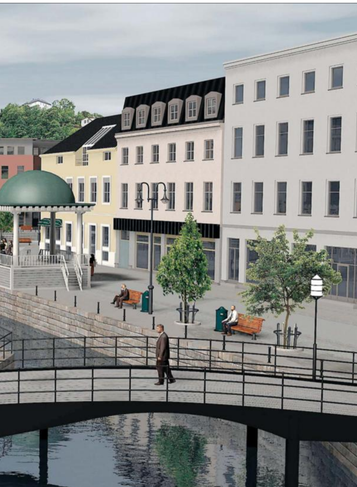
fra Pollen over Kanalplassen. Musikkpaviljongen er kommet opp igjen.