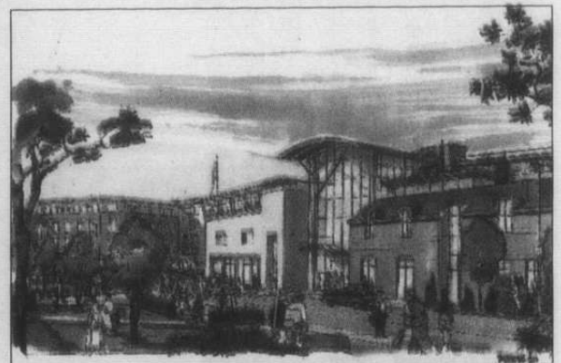
NYBYGG: Slik kan det nye Arena-senteret bli seende ut.