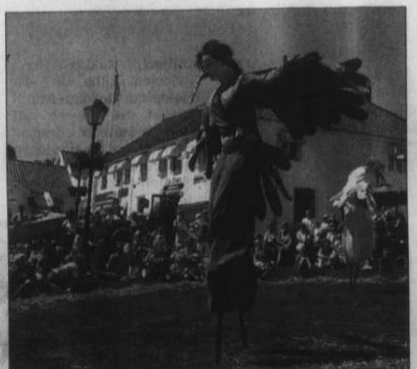
GOD RESPENS: Gruvekompaniet fikk god respons fra store og små med spillet om hegren og tranen i Lillesand tidligere i sommer.