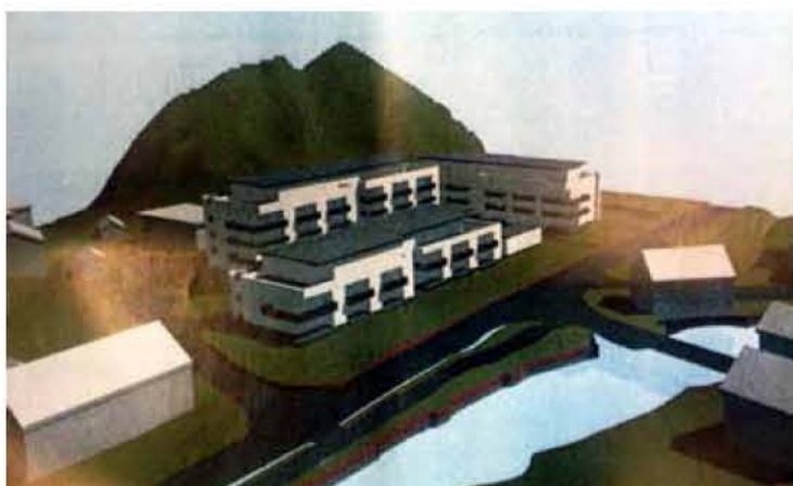
Denne skissen viser hvordan bebyggelsen var tekt i en tidligere fase i prosjektet. Etter innspill fra velforeningen på Lunde er blokkbebyggelsen forkastet. ILLUSTRASJON: ARKADE ARKITEKTER