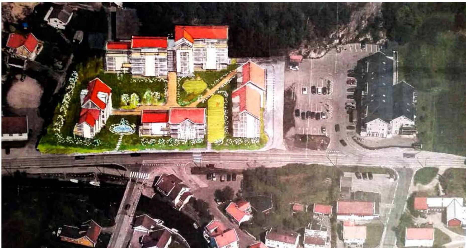
Skissen til den nye bebyggelsen på «Tappen-området» på Lunde, viser bygninger av en helt annen karakter enn det opprinnelige forslaget. ILLUSTRASJON: JAN LINDEBERG

LUNDE. Bygger ut for 150 millioner etter nye skisser