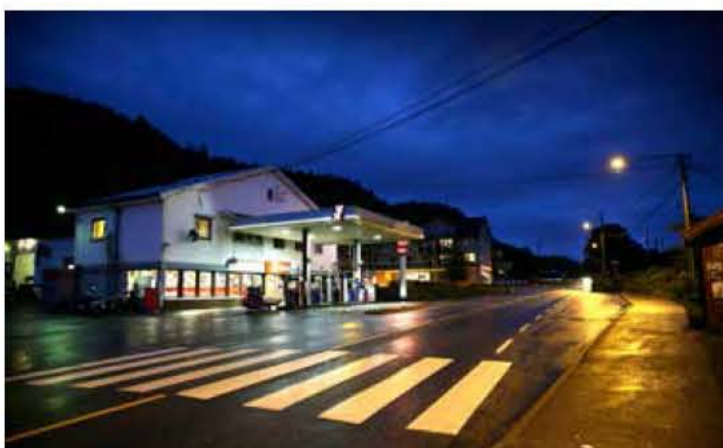
Bensinstasjonen, på folkemunne kalt «Tappen», skal rives for å gi plass til leilighetsbyggene. Planen er å reise mellom 50 og 60 leiligheter på den åtte mål store tomte.

●● Vi ønsker jo å bygge noe som folk liker og som naboer og omgivelser kan trives med.