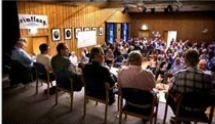
Forbudsplakaten for boligbygging i Lunde var utvalgt på en offentlig utbyggingsmøte for den gamle forslagsutvalget. Partiløse og medlemmer av Frp, FvR, Sp, Venst, Høyre, S, Arbeiderpartiet, SV, Ap og Frp var til stede.