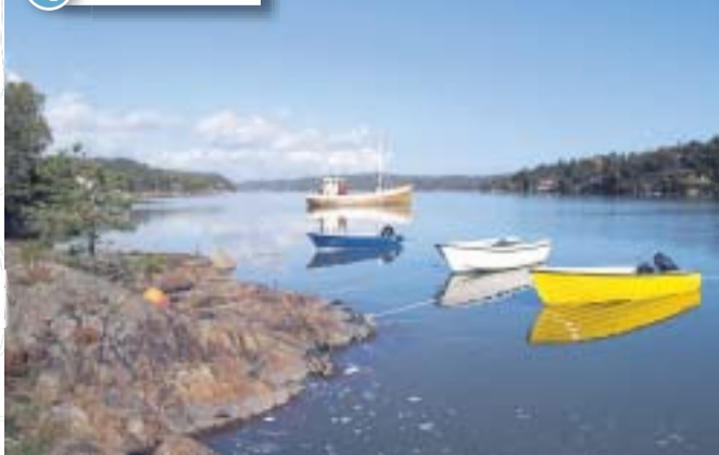
Like nedenfor det som i Flørenesplanen kalles for G-feltet på Haldal ser det så idyllisk ut som dette. Det anslås 300 boenheter.