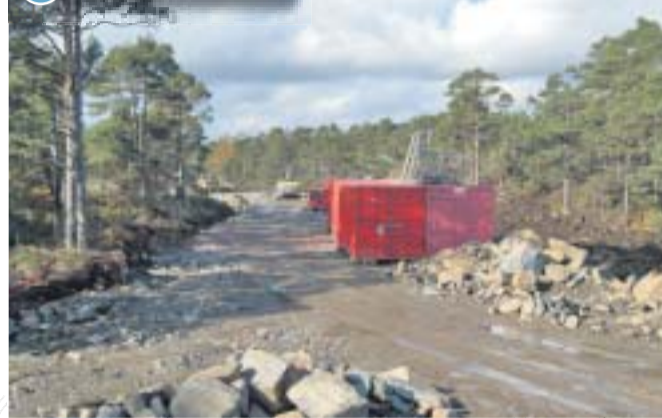
Dette kan bli ett av Lillesands største boligområder med omtrent 500 boenheter. Kanskje vil det komme ny avkjørsel mot sør og gamle E 18