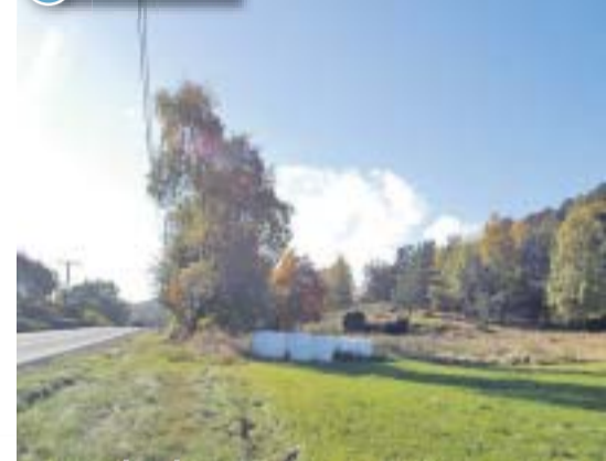
Planprosessen er i gang for et område sør for Vardåsen. Her er stort sett kommunen grunneier. Kanskje blir det 200 boenheter.