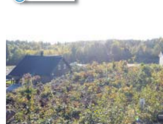
I skogen i bakgrunnen - har kommunen et areal som kan huse omtrent 100 boenheter. Her er det også planlagt barnehage.