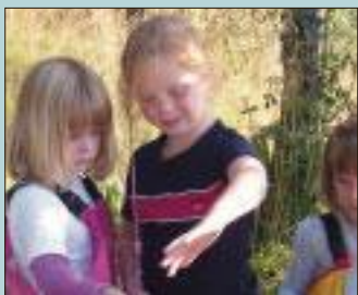
Side 16 og 17