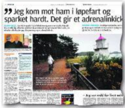
FAKSIMILE: Fra Fædrelandsvennen i går.

Hun ba retten dømme 18-åringen som også er tiltalt for uprovosert å ha slått ned en mann på en restaurant til fengsel i tre år, derav seks måneder betinget. Aktor mente at to år og