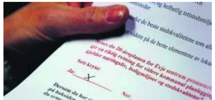
FLEIRTAL: 116 røysta ja til planane som rett nok var ganske vagt formulerte.