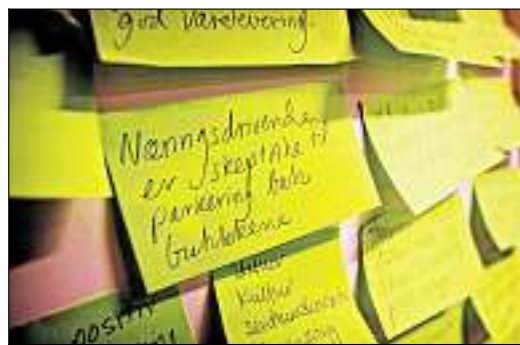
Folket fikk si hva de mente og ønsket seg for Evje sentrum. Ønskene ble blant annet skrevet på klistrelapper, som ble hengt opp på veggen i forsamlingshuset Furuly.