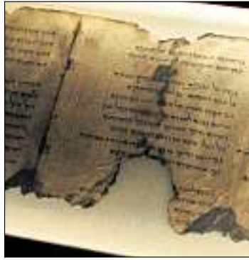
Ny metode skal gjøre det lettere å aldersbestemme dødehavsrullene.