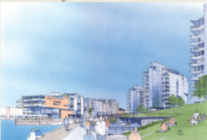
Park med selbasseng