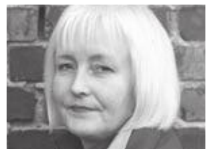
Ellen de Vibe, direktør i Plan- og bygningsetaten i Oslo.