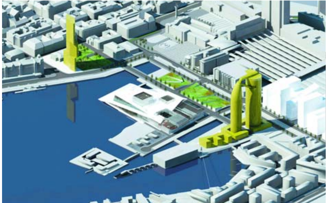
To tårn: Ett av de mest omtalte forslagene til operaens omgivelser inkluderer parker oppå bygninger, liten bebyggelse langs operaens nordside, og to tårn på rundt 120 meter. Forslaget kommer fra Alliance Arkitekter AS, Ascona Tech-nopole/Steven Holl Architects.

Han er sivilarkitekt og partner i Archus arkitekter as, tidligere leder for NAL (Norske Arkitekters Landsforbund), og leder nå komiteen som skal