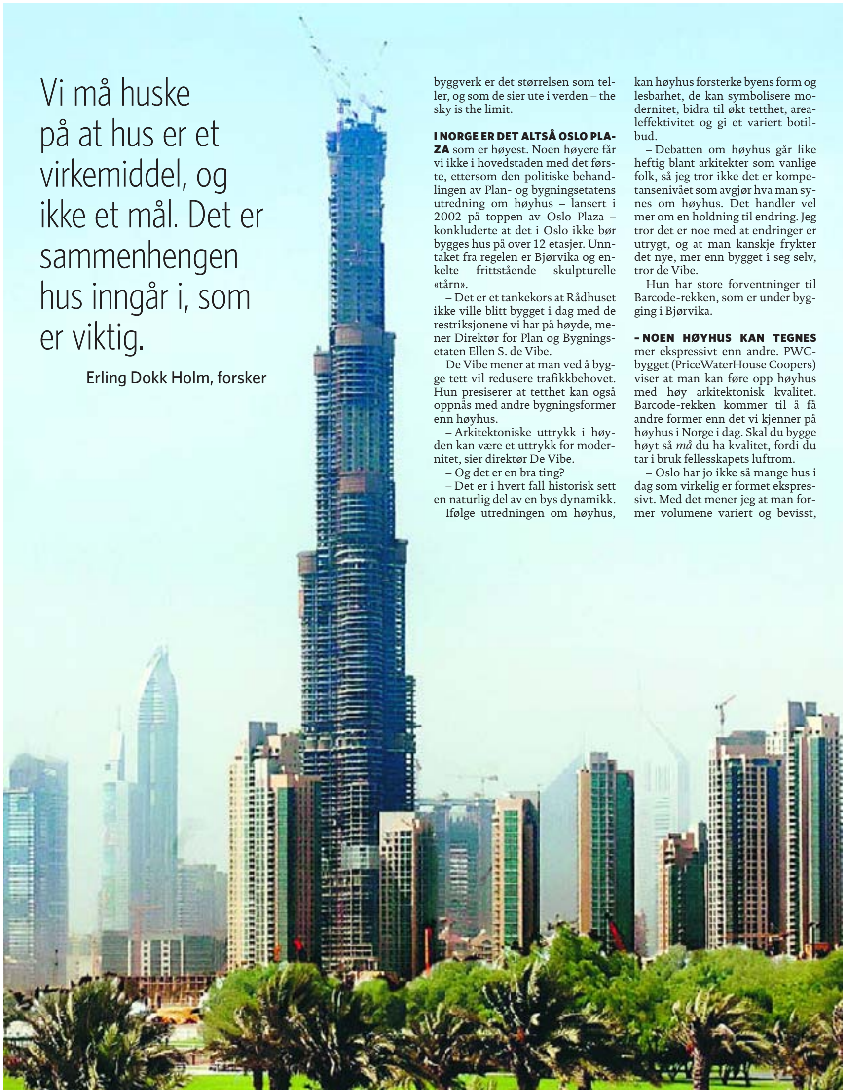
Heia Dubai! De Forente Arabiske Emirater leder konkurransen i sandkassa om å bygge det høyeste tårnet med sitt Burj Dubai. Offisielt leder fortsatt Taiwans Taipei 101, inntil det arabiske tårnet er ferdigstilt.

– Oslo har jo ikke så mange hus i dag som virkelig er formet ekspressivt. Med det mener jeg at man former volumene variert og bevisst,