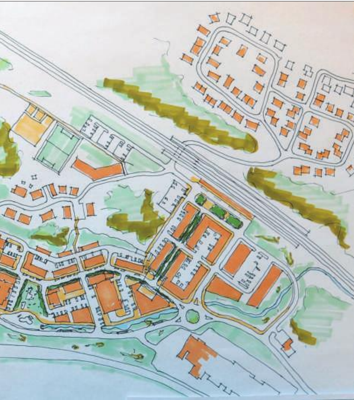
vi sentrum av landsbyen, med sine veier og gater, parkeringsplasser og grønne lunger. I bakgrunnen til høyre ser vi jernbanen.