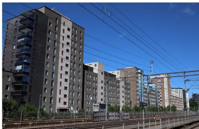
Arkitektur fra regnearkene. Blokkbebyggelsen ved Storo i Oslo har stengt utsikten til fjorden for deler av Grefsen. Her er det avkastningen pr. kvadratmeter som har fått bestemme. Beboerne hadde fortjent så meget bedre.

"Illusjonen som ble opprettholdt i det lengste, var at drabantbyene var sosial boligbygging. Realiteten ble at de mest ressurssterke ordnet seg på annen måte, mens menigmann måtte ta til takke med livet i drabantbyblokk. Dersom det et sted bygges noen riktig trøstsløse blokker, kan vi være nokså sikre på at der skal småkårsfolket få bo, mens de velhavende, for ikke å snakke om arkitektene selv, finner seg noe bedre." QR kode til http://www.allgronn.org/ao/hoyhus.pdf