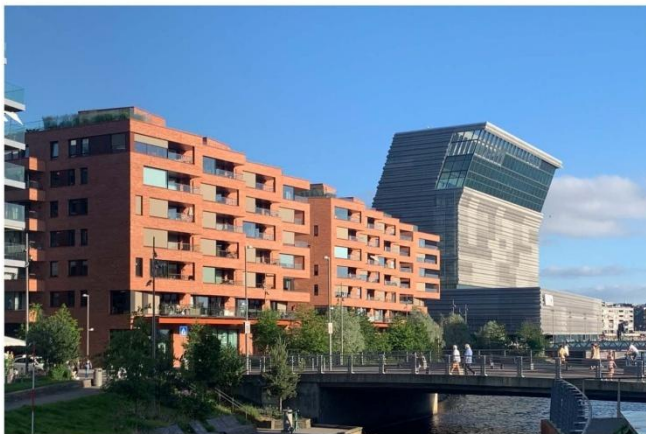
Munch-museet Lambda er monumentet over hvordan Oslos politikere gang på gang satte seg selv i vanry. Kunstnerens hjem, som byen fikk overta, og som skulle ha vært museets selsagte hjerte, ble revet i 1960 og erstattet med en parkeringsplass – et grotesk ungdomsminne for forfatteren som vokste opp i nærheten. Dagens eventyrlig påkostede konstruksjon er spesialbygd for dem som elsker rulletrapper og korridorer. Arkitekturen har ingen berøring med kunstneren selv. Edvard Munch sto nær den organiske modernismen, han hørte til i en epoke preget av jugendstil, art nouveau, Antoni Gaudi, Wienersecessionisme og sjelfull symbolisme, noe som kommer tydelig frem i hans kunst og i hans liv. Oslo Havnevesen har gjennom selskapet Hav Eiendom vært en betydelig pådriver for flytting av Munchmuseet og arkitektkonkurransen som resulterte i Lambda, en del av eiendomsutviklingen i Bjørvika, f.eks. bygningene på Munchs brygge i forgrunnen.

"Det ble umulig å tyde tilhørigheten til et nytt byggeprosjekt, om det ble oppført i Førde, Bjørvika, Chicago eller Yokohama. Dette er den arkitektoniske side ved globaliseringen som vi alle er underlagt. Gradvis blir våre menneskeskapte omgivelser løsrevet fra stedets signatur, nasjonalt, regionalt og lokalt. Den retning i arkitekturen som lenge har hatt overtaket, vil måtte hevde at å gjenskape en lokal dialekt i byggeriet er utenpåklistet staffasje som må avvises strengt, fordi verden er blitt en, og byggeteknikken likeså." QR kode til http://www.allgronn.org/ao/tradisjon.pdf