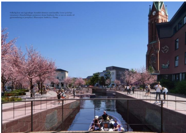
Sterk byplanidé, Kanaler i Arendal