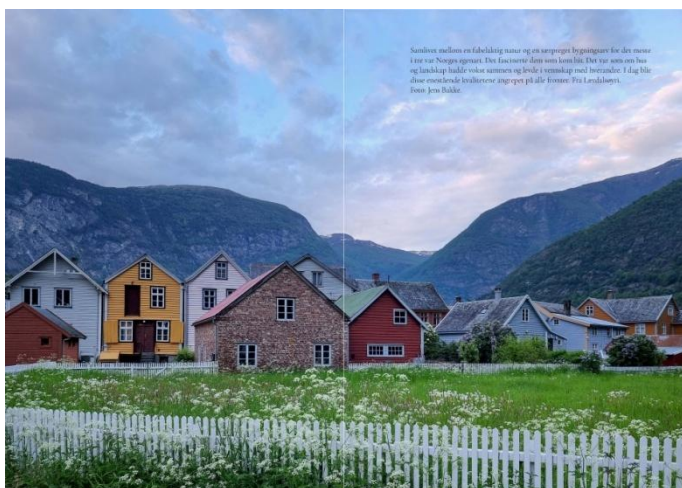
Norsk tradisjon - Fra Lærdalsøyri

QR kode til http://www.allgronn.org/ao/arkitekturmote.pdf