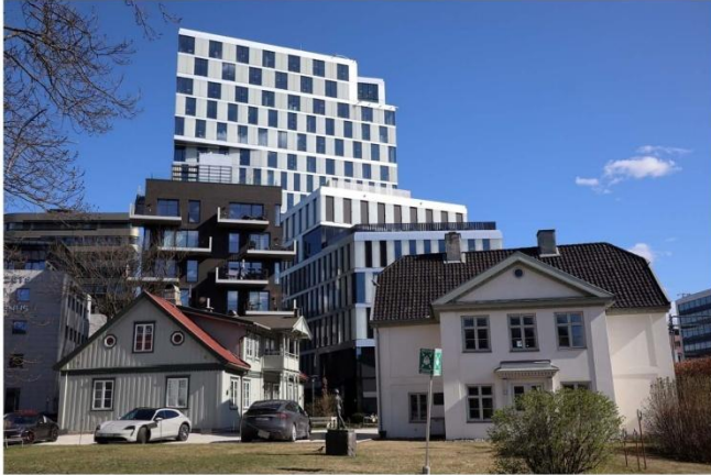
Et fredet hus som de ikke greide å bli kvitt. Sofienlund, Skøyen i Oslo. Den brutale arkitektur og kapitalismen i sin triumferende form viste seg som skapt for hverandre. Her og der ble noen levninger stående igjen av det som ikke hadde vært fullt så innbringende. I bakgrunnen ruver Orklas konsernsenter over et klenodium fra 1813. Arkitekt Narud Stokke Wiig.

"De harde, rette, geometriske former er fremmede i naturen fordi de ikke finnes i naturen. Dermed markeres bruddet med naturen desto sterkere i slike bygninger. Av og til kan de modernistiske bygningene avvike fra kasseformen og framtre som nonfigurative skulpturer i terrenget. Også disse blir som regel fremmedelementer i landskapet, på grunn av det avvikende og stundom lite forståelige i former og materialbruk." QR kode til http://www.allgronn.org/ao/tilpassing.pdf