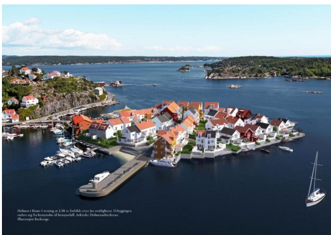
Holmen i Risør, etter kamp for tilpassing

QR kode til http://www.allgronn.org/ao/ideologier.pdf