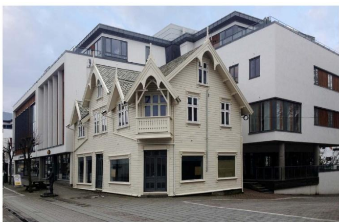
Lokal tilpasning, eller lokal selvskadning? Nav-bygget i Hovedgata 38, Kopervik. Gatebilder som dette er det blitt en del av i våre byer og tettsteder. Stadig spør vi oss hvorfor de lokale politikere kan tillate at stedet får utvikle seg slik. Hvor ble det av stoltheten over stedet de hører til? Arkitekt: Link Arkitektur

"Undersøkelsene bekreftet behovet for å ha stimuli for øyet, at mennesket finner seg best til rette med omgivelser der det er rikelig med ting å feste blikket ved, ikke for lite av stimuli, men heller ikke så mye at det overvelder oss, på den gylne middelvei et sted mellom det nedstrippede nakne og den overleskede forvirring. De ensformige og massive bygningsmiljøer uten variasjon lå høyest på skalaen for fremmedgjørelse." QR kode til http://www.allgronn.org/ao/menneskesinnet.pdf