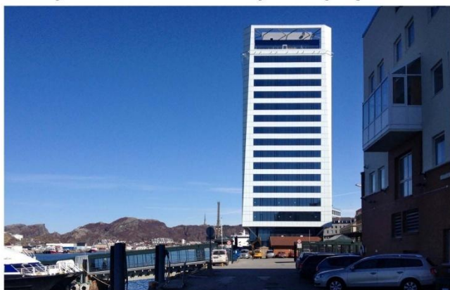
Hotel Scandic Havet, ved kaia i Bodø. Bygg etter samme modell blir reist over hele jordkloden, med det samme formspråk over alt. Dagens toneangivende arkitekter fordømmer det de kaller stilkopier, men dette er i sannhet en stilkopi, her utført av arkitektkontoret Boarch. De nasjonale og lokale formspråk innen byggekunsten blir drevet bort og verden blir ensrettet. Videreføring av stedets og områdets byggeskikk er i mange år blitt ansett som utenkelig av de fleste større utbyggere.

QR kode til http://www.allgronn.org/ao/kapitalkreftene.pdf