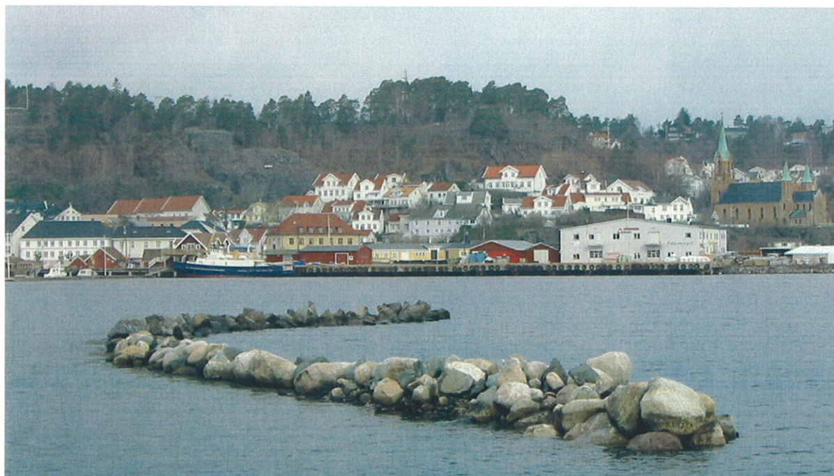
Dampskipskaia sett fra Galeiodden med Andølingen, Jøransberg og Kragerø kirke i bakgrunnen