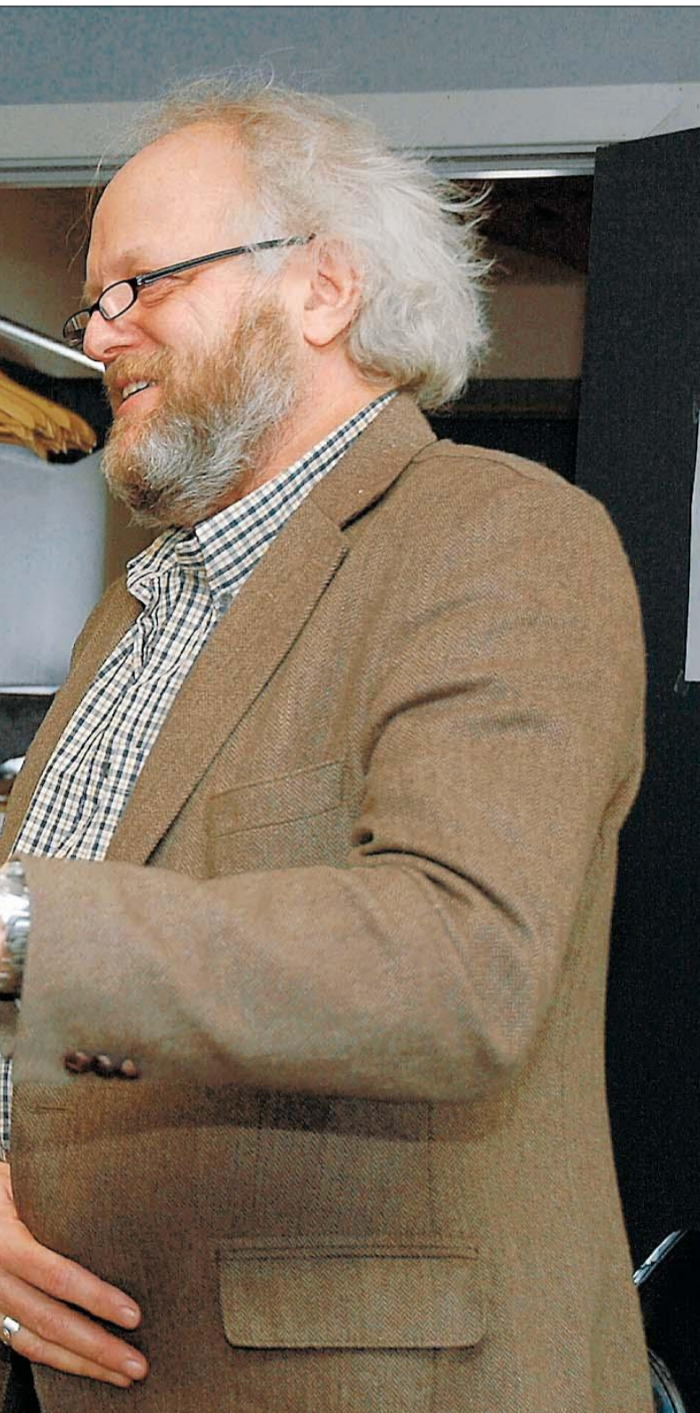
utvikling er langt fra en suksess.